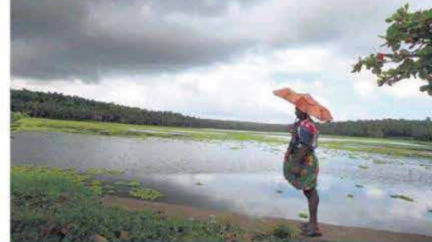
■ (Above and below) People enjoy the first monsoon rains in Thiruvananthapuram.

The Met has spoken, and it's good news: the monsoon has arrived in Kerala