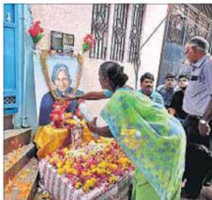
(Top) Tamil Nadu minister O Panneerselvam and other leaders offer their last respects to former President Abdul Kalam on Wednesday. (Above) People pay tributes to the former president outside his home in Rameswaram.