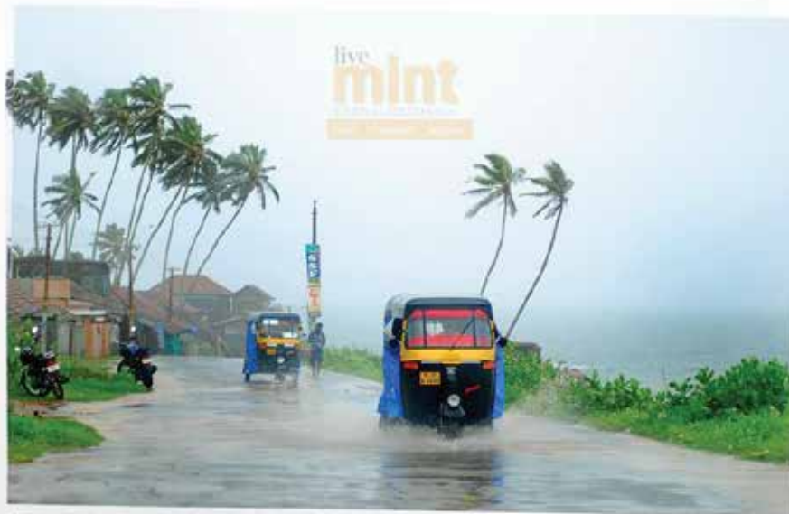
Kerala, coastal Karnataka, Konkani, Goa and south Maharashtra will see heavy rain at one or two places during the next 48 hours.