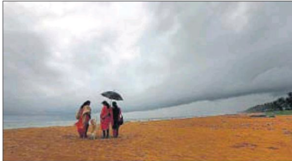
■ People enjoy the rain at Veli beach in Thiruvananthapuram after the southwest monsoon hit Kerala and the Northeast on Monday, two days ahead of schedule. >>P8