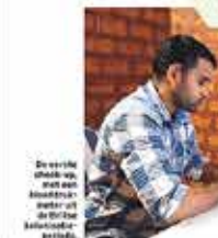
DE DRIE De drie dokters die ik heb ontmoet in India.

OF KIESEN ZONDER PUNZAL BLUTENSTAPPEN, VRAAG IK DE ENKE DOKTER KINKT DRITTIK VAN JA. OF LESS PANY, VOGDET DE VROUWDE DOKTER ER VOORZICHTIG AAN TOE. ZIJ LEUK ME AL DE RIEMERSTE VINK DE DRIE