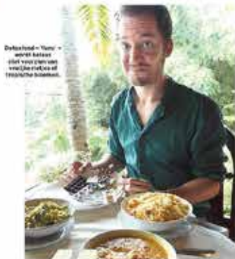
Dokterhand - 'Yogi' - wordt behandeld voor psoriasis en eczeem.