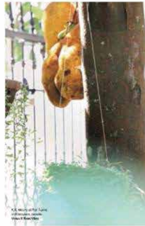
K.R. Meera at her home in Bangalore, India

Feminist Malayalam writer K.R. Meera speaks of the trauma of writing, and the rediscovery of her self through her words