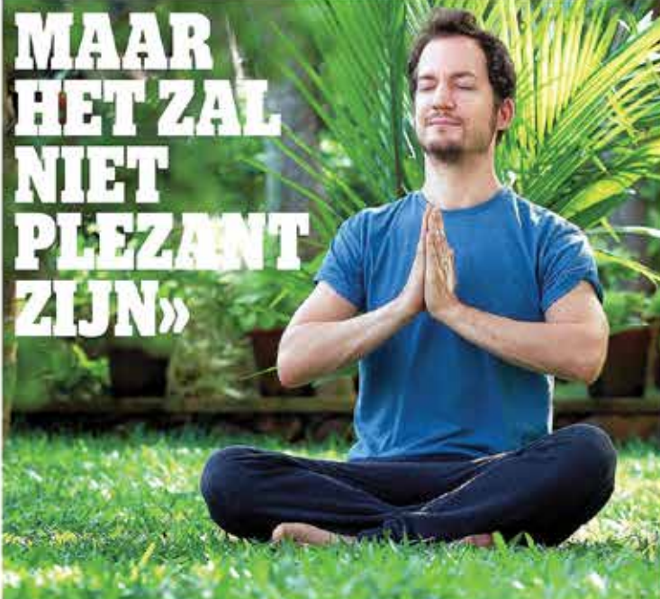
Deze reporter vestigt aan het mediteren, hij aan goed herbeuven

INPUTTING HEBLIJNNAAR DE NORM IN HET BEGYN, MET ALS MISSELDORHEID, BEWAICHTSPUN, MIGRANE EN EEN CONTINUÏ VERSTOORDE MAAG