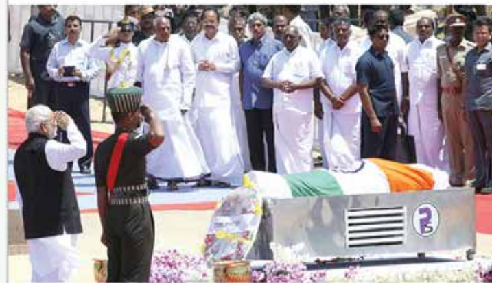
Prime Minister Narendra Modi pays homage to the former president APJ Abdul Kalam in Rameswaram, Tamil Nadu.