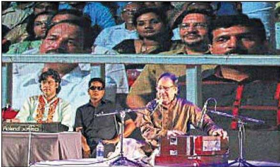
■ Protests by Shiv Sena activists notwithstanding, Pakistani ghazal legend Ghulam Ali performs before a packed house in Thiruvananthapuram.